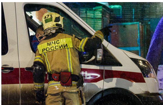
Фото: російський МНСник (Getty Images)

Обирайте перевірене - додайте РБК-Україна до улюблених джерел у Google