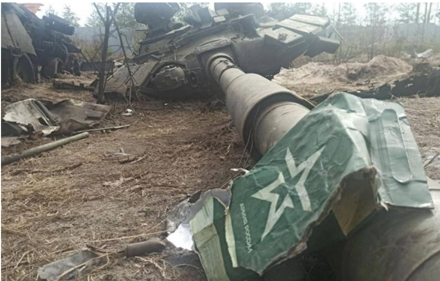
Наступальні потуги рашистів в квітні зазнали невдачі

Мета ЗСУ – досягти такого рівня втрат окупантів, за якого їхнє подальше просування стане неможливим.