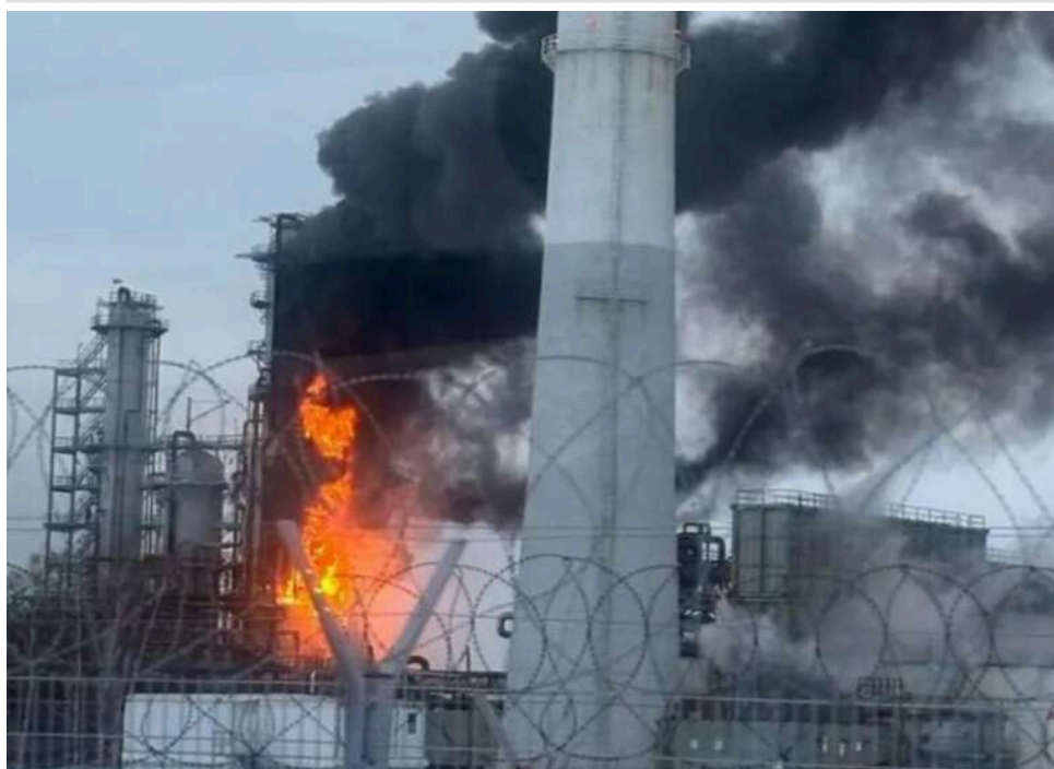
Удар по бюджету війни: СБУ атакувала один із найбільших НПЗ Росії в Ленінградській області

Виконуючи поставлені Президентом України завдання, бійці «Альфи» СБУ спільно із Силами оборони (ССО та СБС) провели успішне ураження об'єктів нафтоінфраструктури в Ленінградській області РФ. «Бавовна» палає на НПЗ «Кірішінафтооргсинтез», а також на нафтоперекачувальній станції «Кіріши».