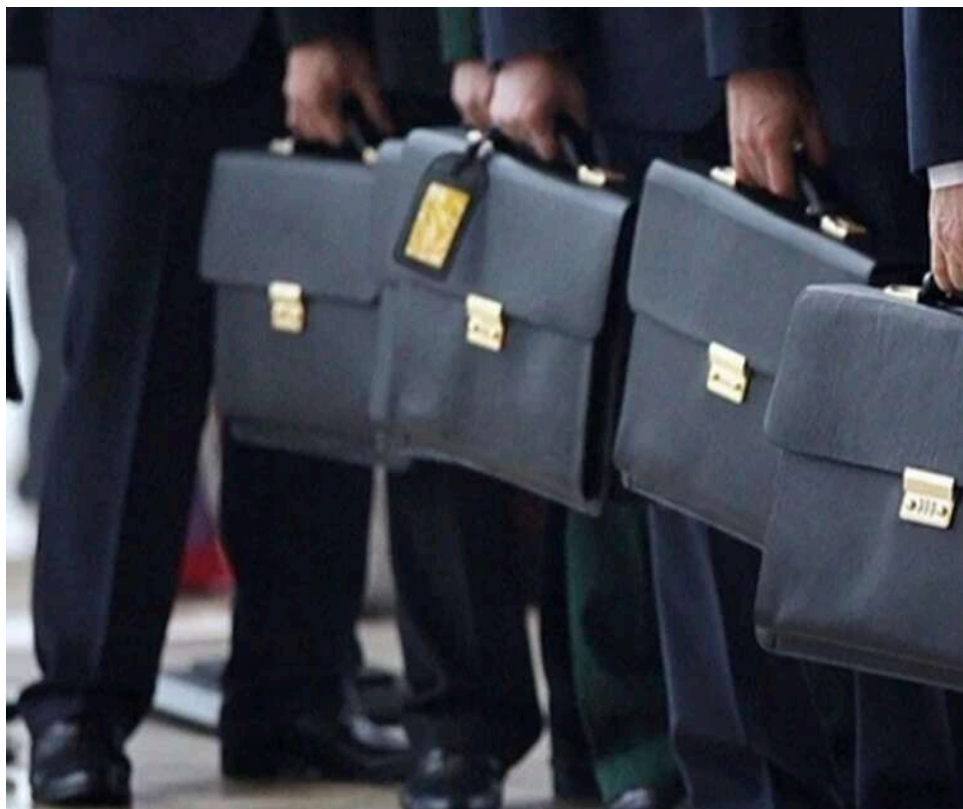
Зарплати держслужбовців у березні: де платять найбільше та як змінилася чисельність чиновників

Міністерство фінансів України оновило «дашборд» за березень щодо оплати праці та чисельності працівників державних органів, місцевих державних адміністрацій і органів судової влади. Згідно з документом, найвищі зарплати – майже 100 тис. грн – отримують в Антимонопольному комітеті та Національній комісії, що здійснює державне регулювання у сфері енергетики та комунальних послуг.