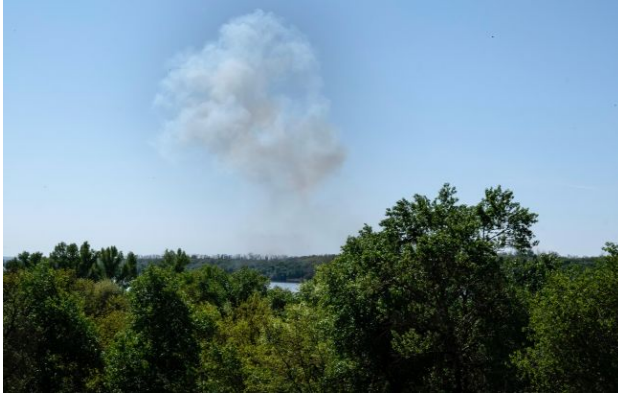
Ілюстративне фото: вибух

Обирайте перевірене - додайте РБК-Україна до улюблених джерел у Google