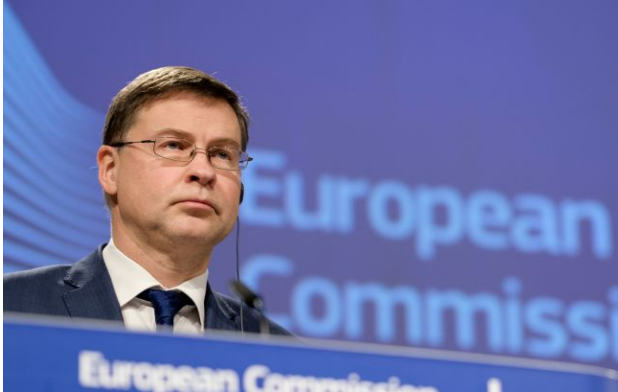
Фото: Валдіс Домбровскіс

Обирайте перевірене - додайте РБК-Україна до улюблених джерел у Google