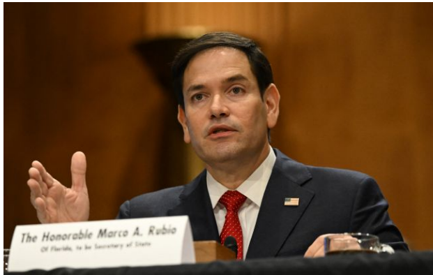
Фото: Марко Рубіо (Getty Images)

Обирайте перевірене - додайте РБК-Україна до улюблених джерел у Google