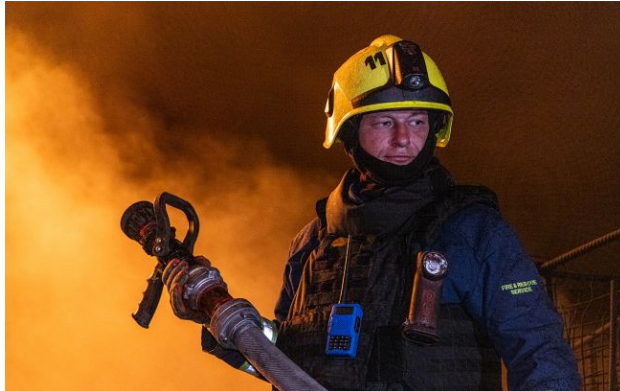
Фото: наслідки атаки уточнюються (facebook.com/DSNSKHARKIV/)

Обирайте перевірене - додайте РБК-Україна до улюблених джерел у Google