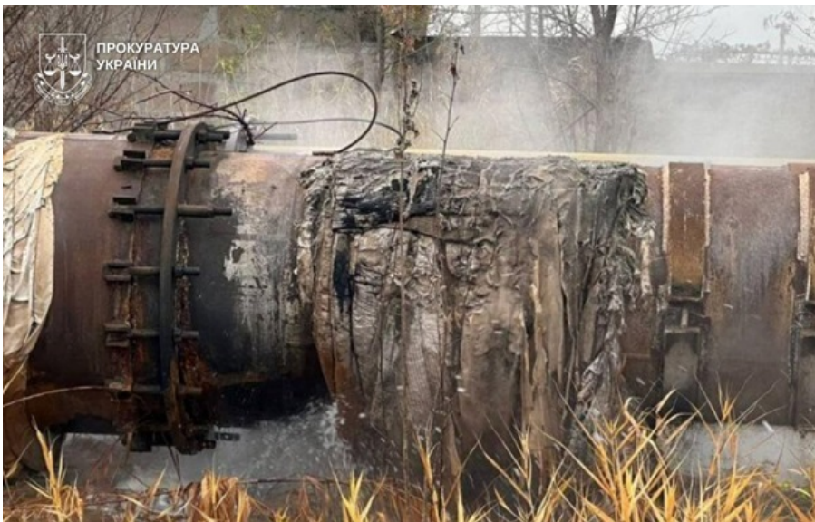
У Кривому Розі розслідують недбалість головного інженера теплоцентралі

Рішення посадовця фактично вивело з ладу частину тепломереж міста. Упродовж двох опалювальних сезонів мешканці чотирьох районів залишалися без стабільного теплопостачання.