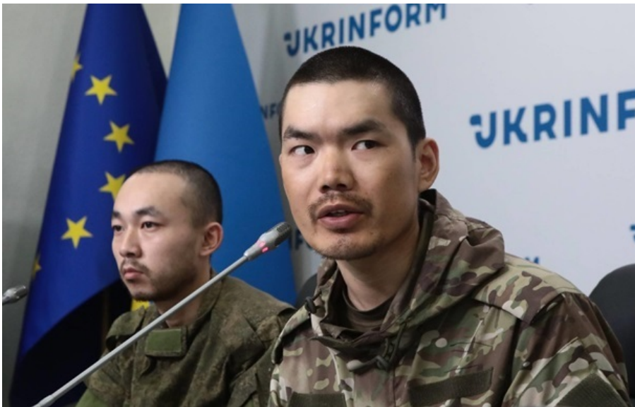
Двоє китайців і досі пробувають у СІЗО Служби безпеки України

Пекін застерігає громадян КНР від поїздок у зони збройних конфліктів та участі у бойових діях на боці будь-якої держави.