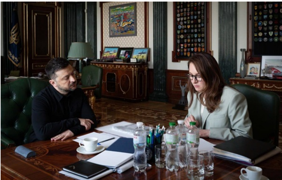
Зеленський і Свириденко під час наради 6 травня

Також повинно бути оперативно проведене і перезавантаження визначених державних підприємств.