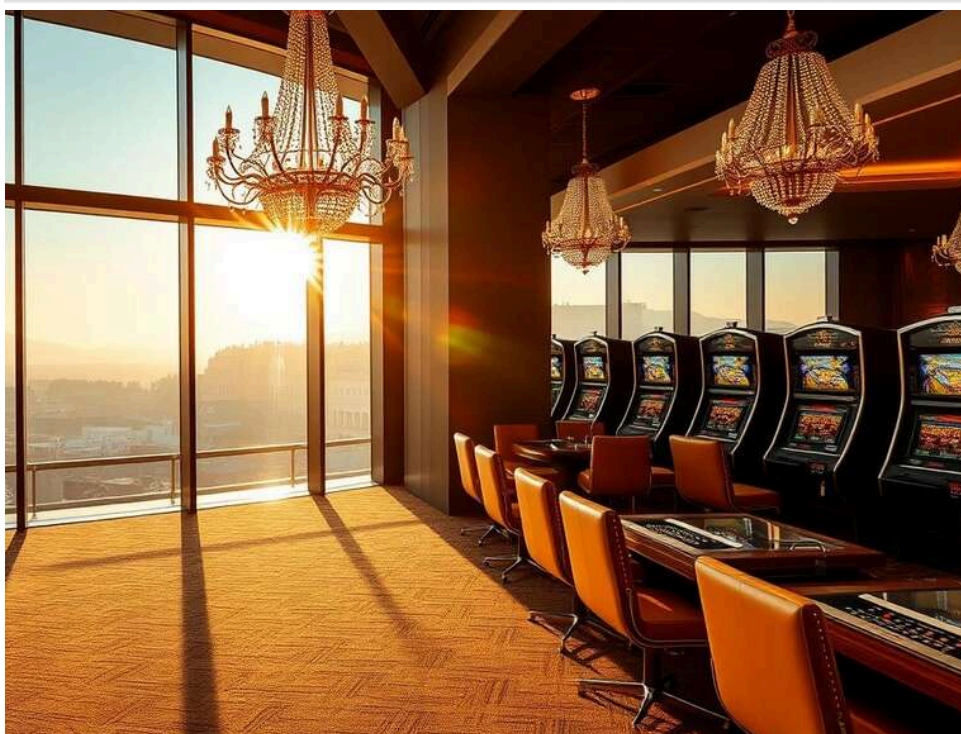
DMCA-атака на регулятора: як офшорні казино намагаються видалити сайт KSA з пошуку Google

Офшорні оператори атакують нідерландського регулятора DMCA-скаргами, щоб вибити KSA з Google.