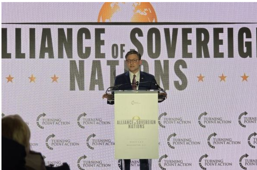
Спікер Палати представників США Майк Джонсон виступає на конференції «Альянсу суверенних націй»

Читайте також: Рік бабака чи подвійна гра? Деякі підсумки української миротворчості Трампа