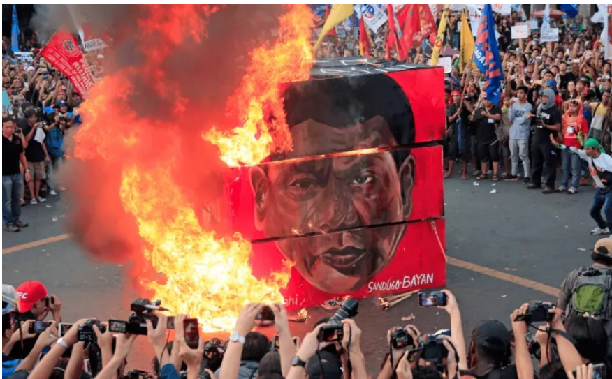
Протестующие сжигают портрет Дутерте в сентябре 2017 года.

В сентябре 2017 года тысячи филиппинцев вышли на митинг против «формирующейся диктатуры». Протестующие требовали остановить убийства и жгли портреты Родриго Дутерте.