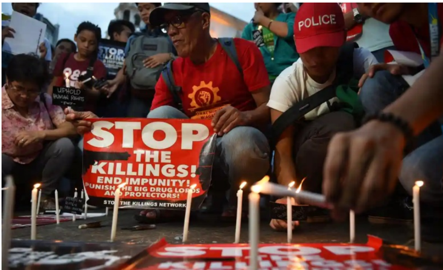
Активисты зажигают свечи перед церковью в Маниле.

На эту тему: На Филиппинах 600 тысяч подозреваемых в наркоторговле сдались властям