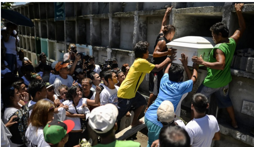
Похороны подозреваемого в торговле наркотиками.

По данным правозащитников, в числе жертв были люди, подозреваемые в совершении преступлений или употреблении наркотиков, беспризорные дети и граждане, которых приняли за кого-то другого. Нелегальным казнями занимался так называемый «Эскадрон смерти из Давао»: комиссия по правам человека выяснила, что с 2005 по 2009 годы они убили 206 человек, 107 из которых имели судимости или подозревались в преступлениях.