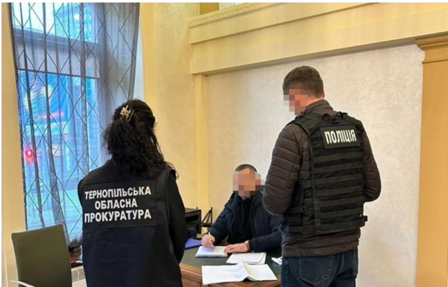
Підозру оголосили забудовнику та ще трьом особам

У центрі Тернополя під видом реконструкції знищили культурний шар і звели багатоповерхівку.