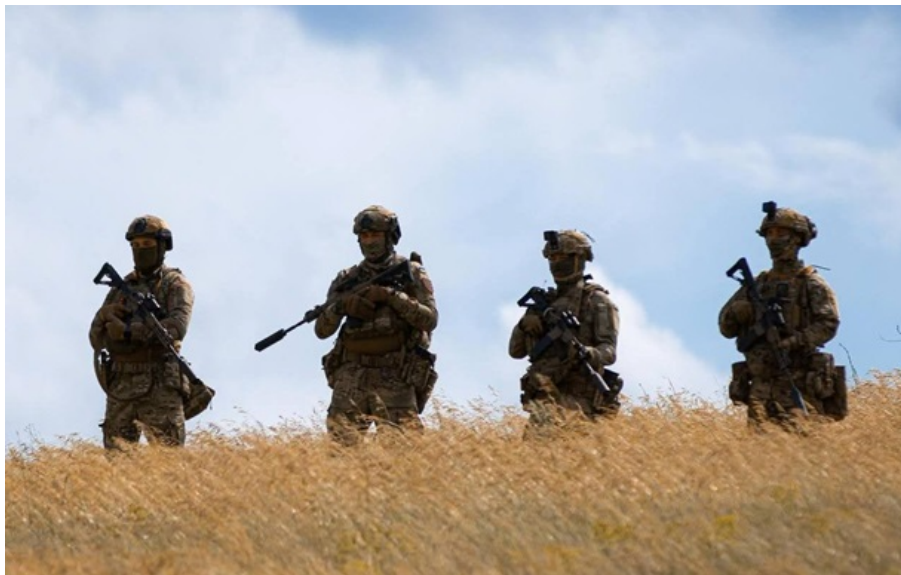
ЗСУ стримують російські атаки на сході і півдні України

Майже половина російських атак сконцентрована поблизу Покровська у районах п'яти населених пунктів.