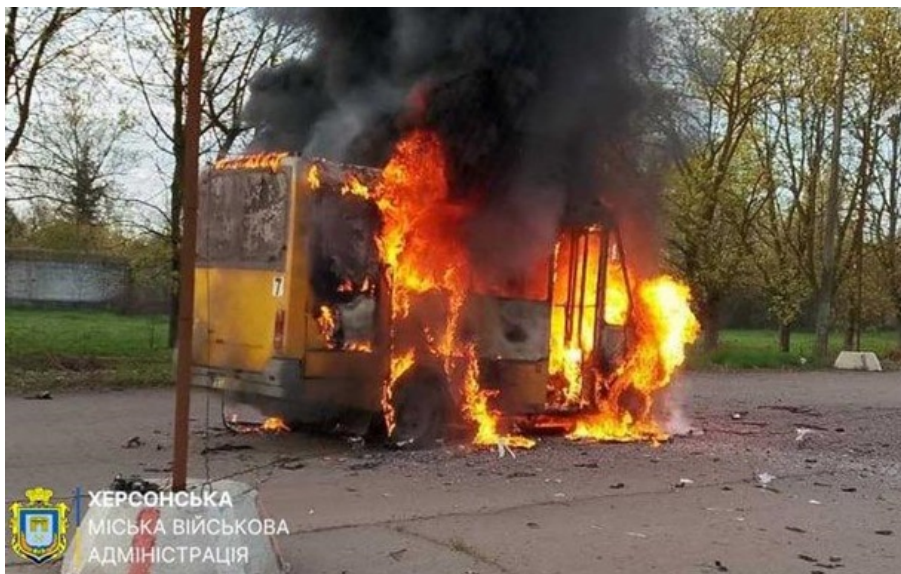
Російський дрон вщент спалив маршрутку в Херсоні

Під російський удар потрапив маршрутний автобус приватного перевізника. Водій з пасажирами не постраждали.