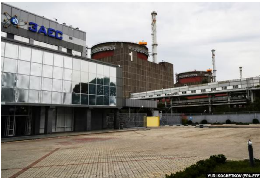
Запорізька атомна електростанція (ЗАЕС) поблизу міста Енергодара Запорізької області, 22 серпня 2022 року

Читайте також: На укрітті саркофагу над четвертим енергоблоком Чорнобильської АЕС після удару "Шахеду" виявлено ще три осередки тління