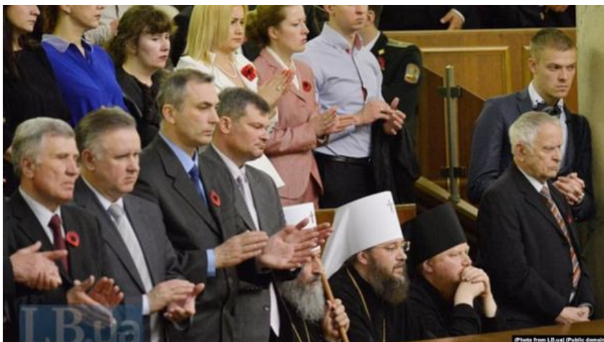
У 2015 році під час виступу президента Петра Порошенка Онуфрій не встав разом з усіма, коли згадували українських військових.

«Поки це були просто слова, вони не були якимось таким страшним тригером. Тим більше ви ж не забувайте, що я харківський хлопчик і в більшості з нас не було такого радикального патріотизму. Ми до цього дуже спокійно ставилися. А от коли побачили вже певні дії, анексію Криму й Донбасу, то все склалося до купи. І стало зрозуміло, для чого ми все це говорили. Це все готувалося заздалегідь», — каже отець.