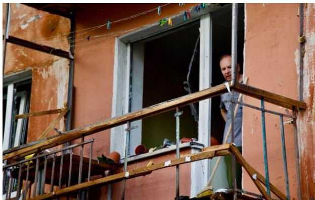
Фото: наслідки атаки на Дніпро 7 травня (t.me/dnipropetrovskaODA)

Обирайте перевірене - додайте РБК-Україна до улюблених джерел у Google