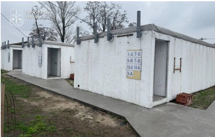
На Дніпропетровщині підозрюють ексочільника громади

Укриття мали забезпечити безпеку учнів, педагогів і мешканців громади під час повітряних тривог.