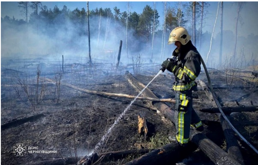
Ліквідація пожежі в Чернігівській області

Росіяни нищать спостережні щогли із системою відеонагляду, щоб "осліпити" пожежні загони лісової охорони.