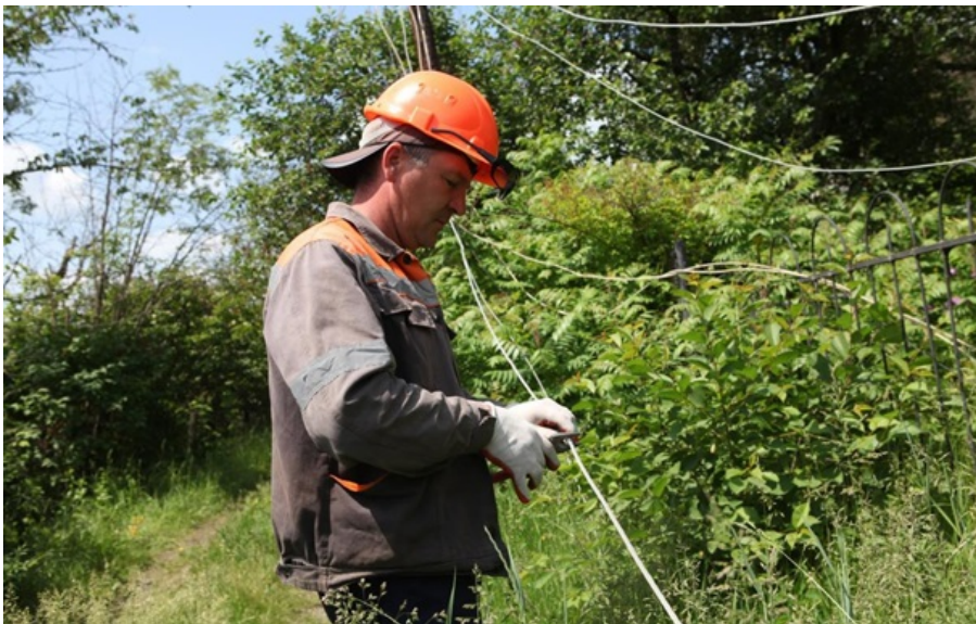
Ремонтні бригади обленерго займаються відновленням пошкоджених ліній

Вимушені знеструмлення обіцяють скасувати одразу після стабілізації ситуації в мережі обленерго.