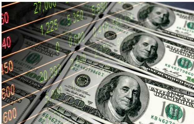
Фото: НБУ оновив офіційний курс валют на 11 травня (Getty Images)

Обирайте перевірене - додайте РБК-Україна до улюблених джерел у Google