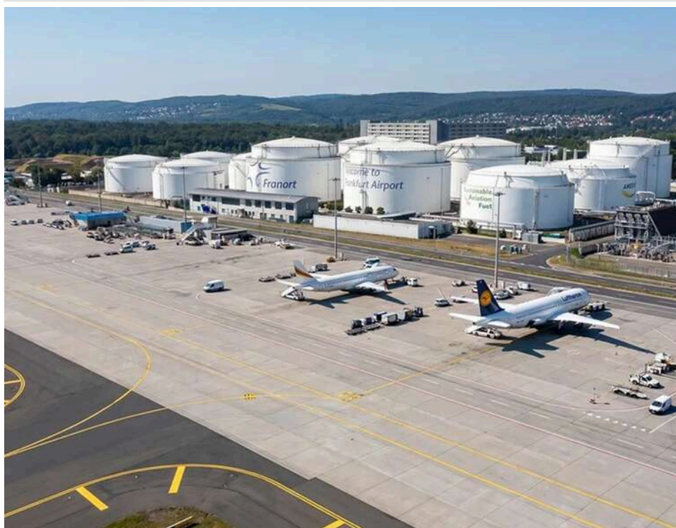
Під загрозою 20 мільйонів пасажирів: через дефіцит пального в Німеччині готуються до масового скасування авіарейсів

Близько 20 мільйонів авіапасажирів у Німеччині можуть постраждати від скасування рейсів через нестачу керосину, повідомляє німецьке видання WELT з посиланням на главу асоціації німецьких аеропортів Ральфа Байзеля.