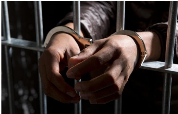
Фото: на нападника очікує суд

Обирайте перевірене - додайте РБК-Україна до улюблених джерел у Google