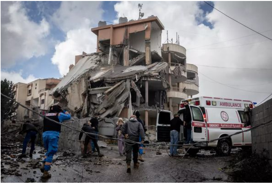
8 квітня в Набатіє (Ліван) парамедики та місцеві жителі поспішають до будівлі, яка щойно зазнала удару Ізраїльської авіації.