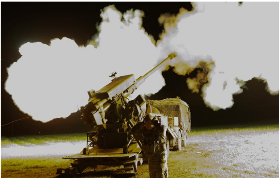
На Слов'янському напрямку Сили оборони успішно відбили п'ять спроб росіян просунутися