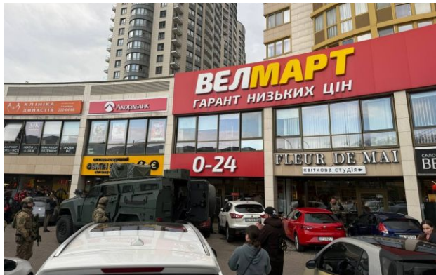
Фото: у Києві сталася стрілянина

У Києві надвечір сталася стрілянина. Чоловіка, який вбив та поранив кількох людей та забарикадувався у супермаркеті, ліквідували.